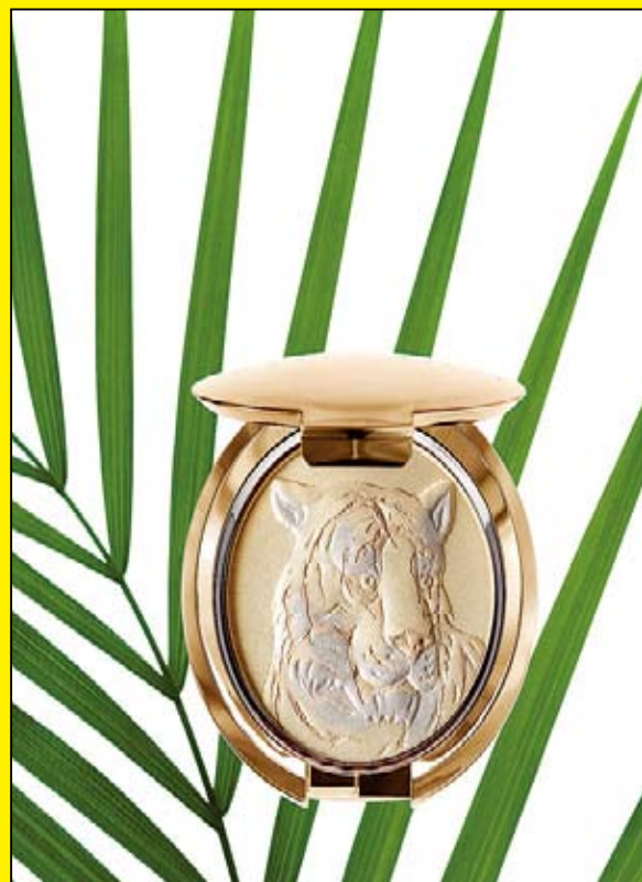
支持保護孟加拉虎的限量版 Bengali Bronzer。