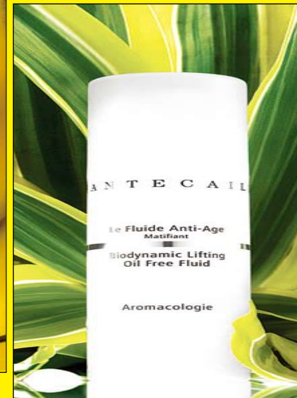
Biodynamic Lifting Fluid 可煥發肌膚。