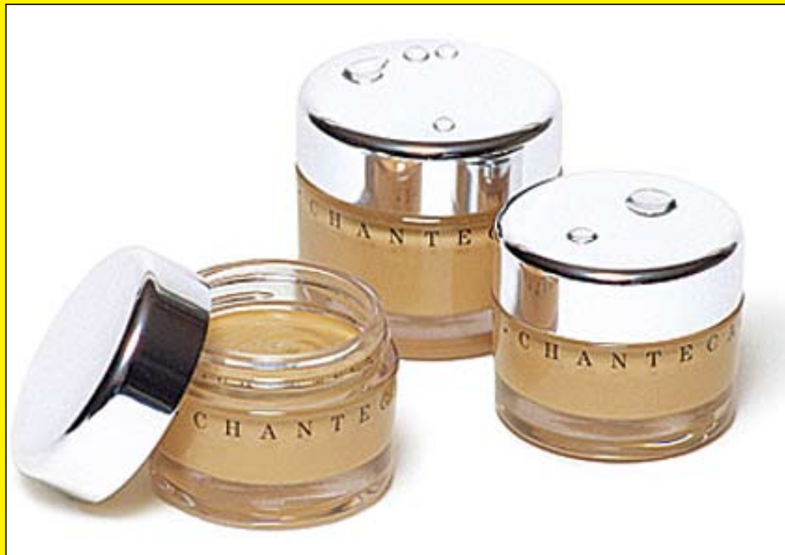
Future Skin Foundation控油效果明顯。