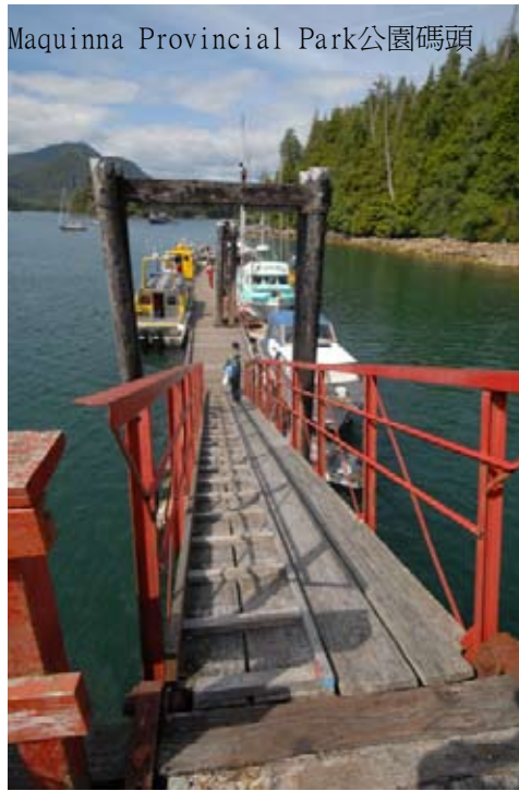
Maquinna Provincial Park公園碼頭