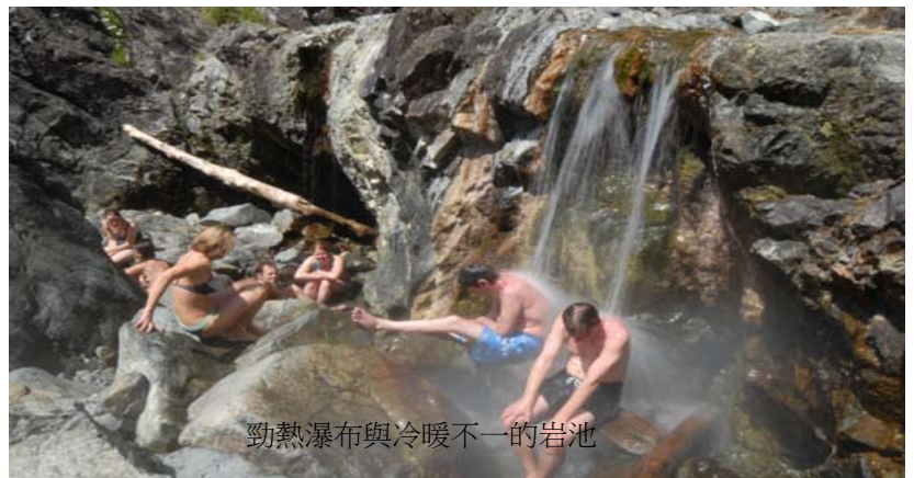
勁熱瀑布與冷暖不一的岩池

這個名為Hot Springs Cove的溫泉其實位於Tofino北邊約37公里的Clayoquet Sound的Maquinna Provincial Park內，大概要花費近100元來回坐船前往。只要與船公司