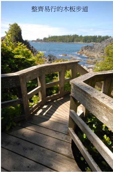
整齊易行的木板步道